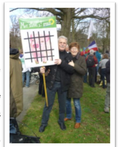
Demo gegen Massentierhaltung

Auch angesichts der kurz zuvor veröffentlichten Studie der Grünen zur „Qualzucht in der Nutztierhaltung“ und dem auch regional zunehmenden Bewusst-